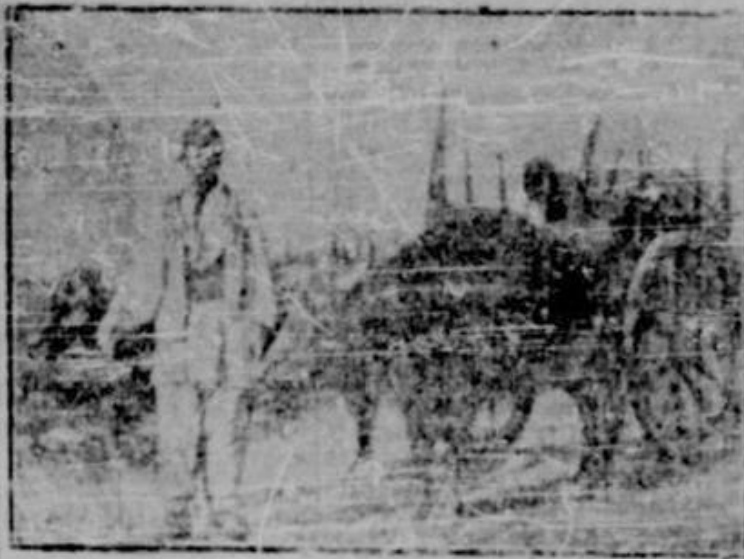
Pictură de Tahtunor